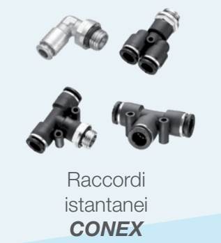
Raccordi istantanei CONEX