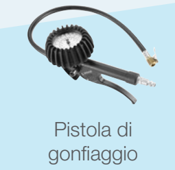
Pistola di gonfiaggio