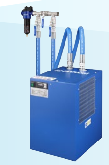
FRL Filtri submicronici Essiccatori Gestione della condensa