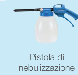
Pistola di nebulizzazione